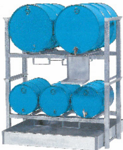
W-2 / SR-2 / SR-3