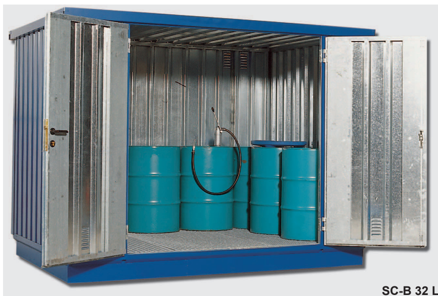
SC-B 32 L