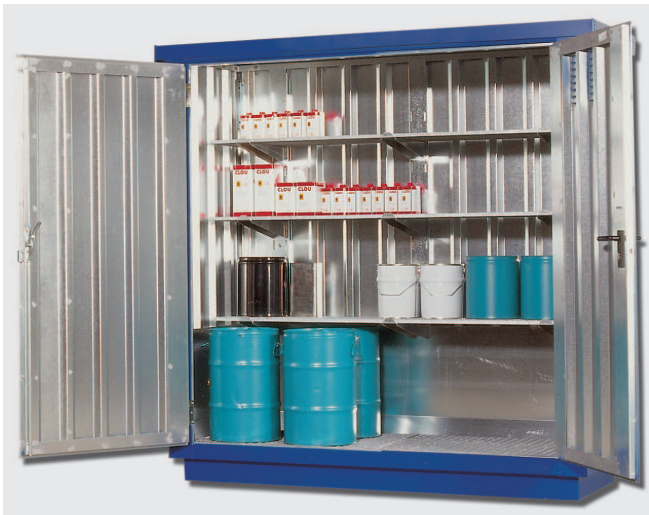
SC-B 21 L mit Einbauregal