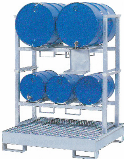
W-2 / SR-2