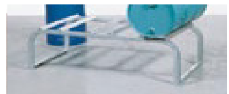
Fassbock FA-6 verzinkt