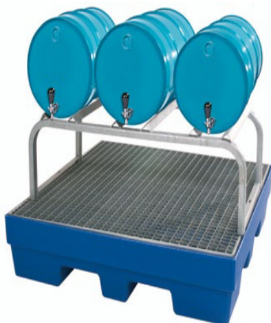
PSW-8 R / SR-2 / SR-3

Stapelrahmen und Fassböcke nur verzinkt lieferbar