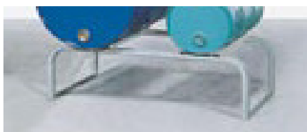
Fassbock FA-5 verzinkt